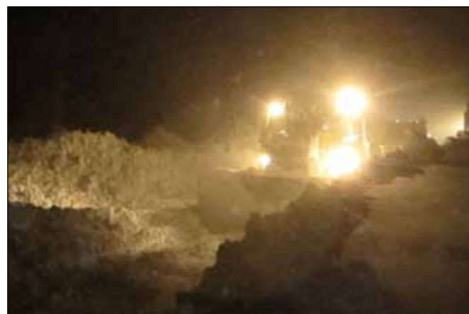
Snjómokstur á Vestfjarðavegi (60) í Kjálkafirði 30. desember. Sjá einnig forsiðu. Myndin til hægri er frá sama verkefni og er birt hér til að minna á að birtu nýtur ekki við í margar klukkustundir á degi hverjum í desember svo snjómokstur er mestan part unninn í svarta myrkri.