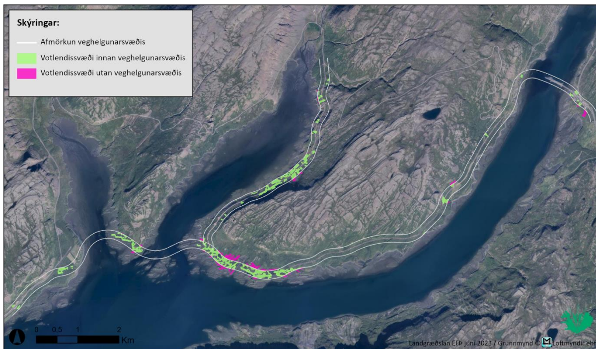
Kort 1. Yfirlit yfir votlendissvæði sem raskast vegna vegaframkvæmda, bæði innan og utan veghelgunarsvæða.