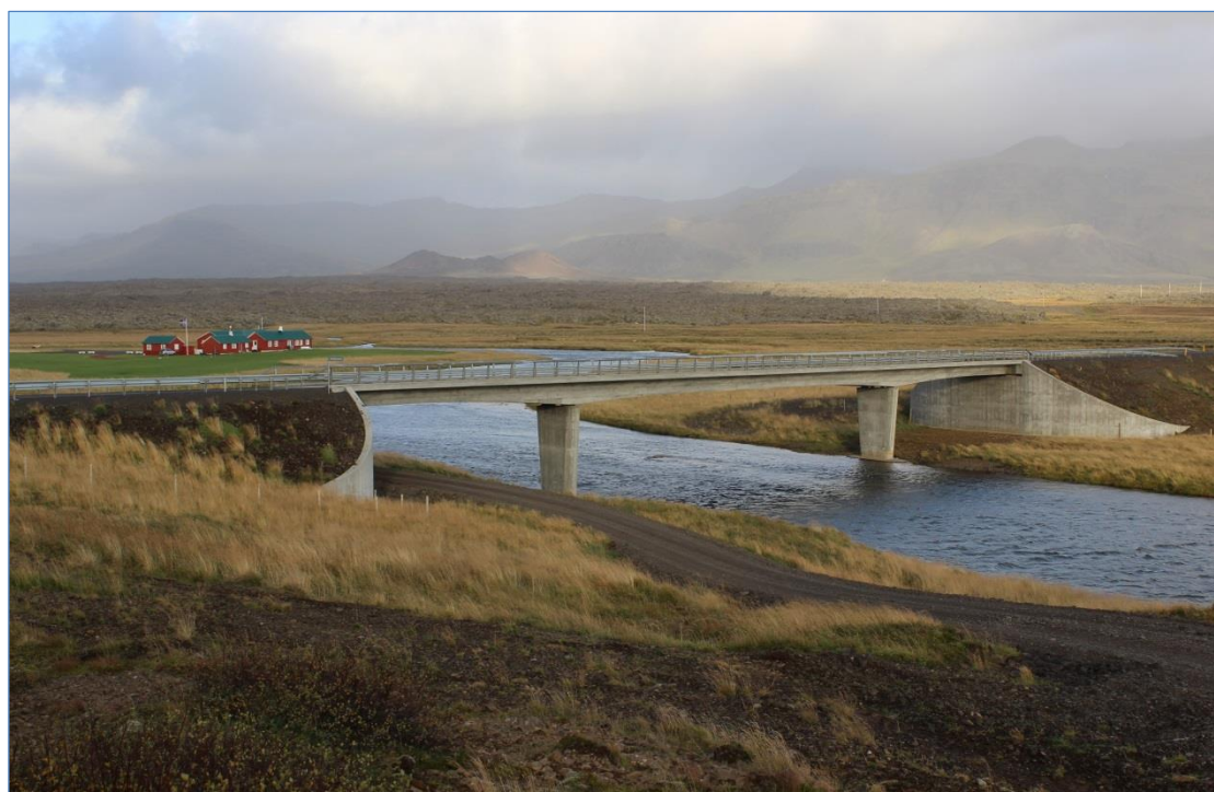
Snæfellsnesvegur (54) um Haffjarðará.