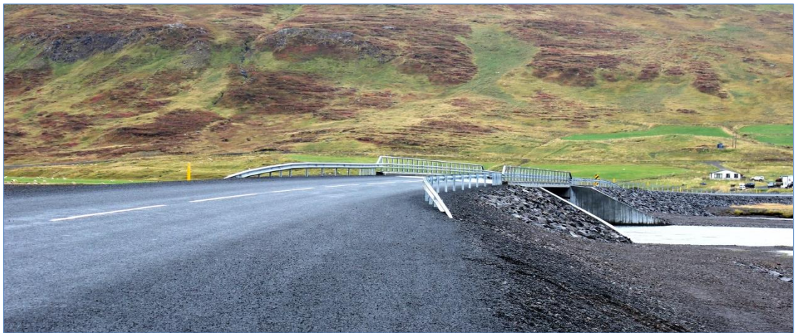
Strandavegur (643), Djúpvegur – Geirmundarstaðavegur.