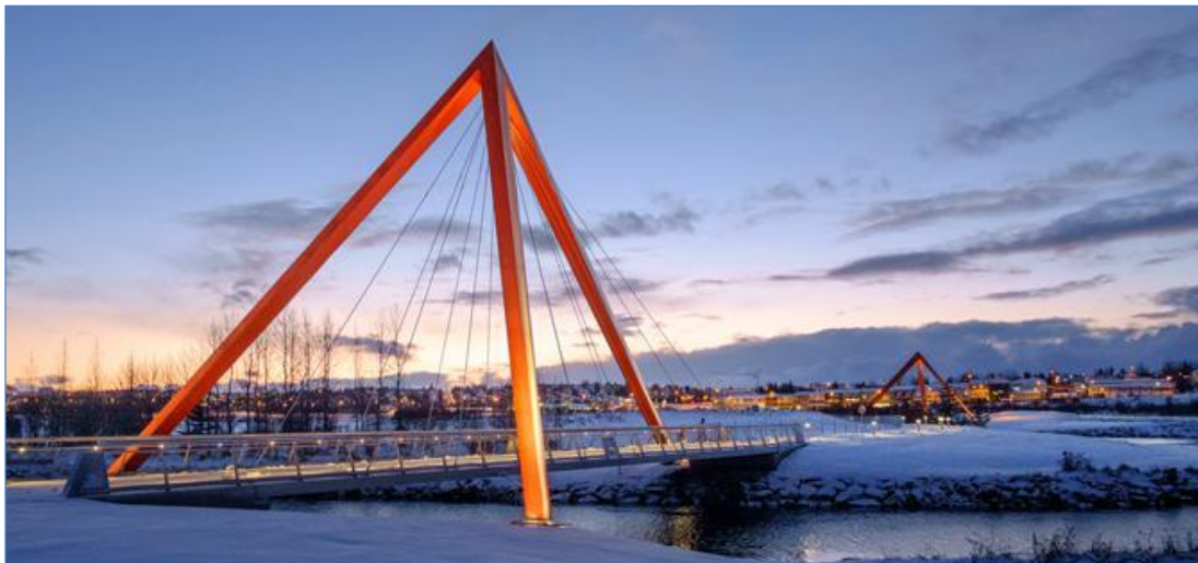
Göngu og hjólabrýr við Elliðaár.