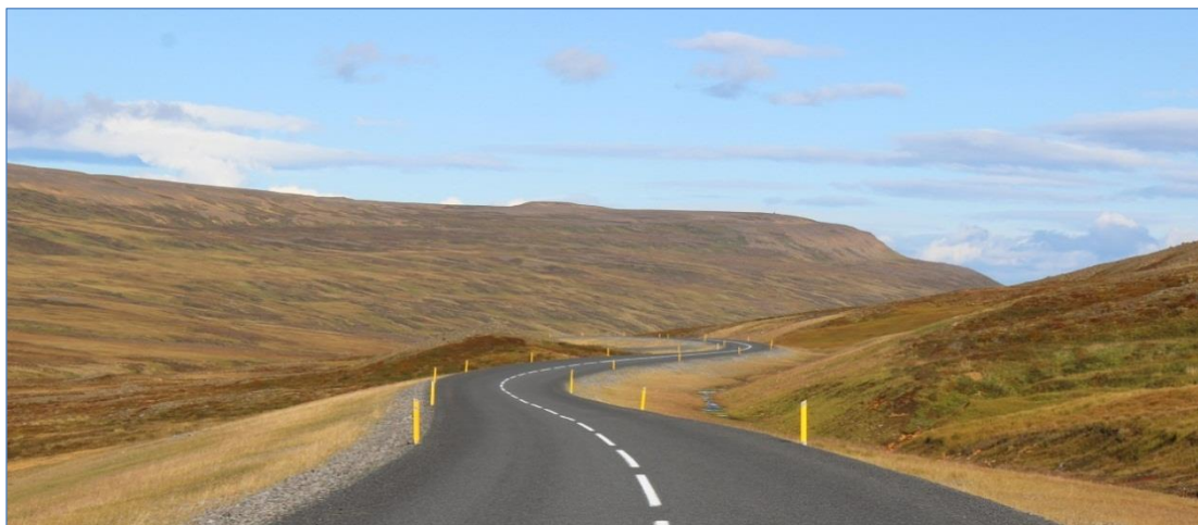
Norðausturvegur (85), tenging Vopnafjarðar við Hringveg.