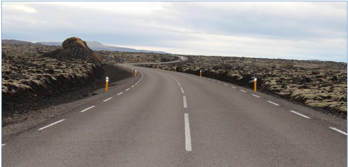
Suðurstrandarvegur (427), Grindavík – Þorlákshöfn.