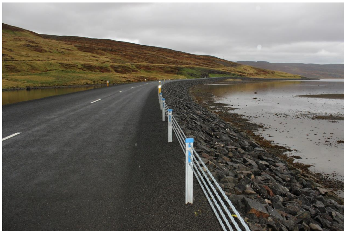
Strandavegur (643), Djúpvegur – Geirmundarstaðavegur.