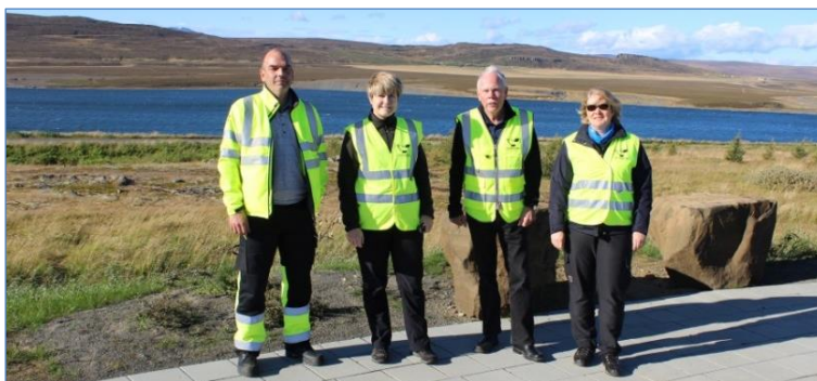
Dórnefndin og ritari að störfum.

Þessi atriði voru síðan vegin saman og heildarniðurstaðan réð vali dórnefndar, sjá matsblað á næstu blaðsíðu.