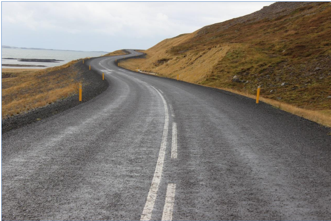
Vestfjarðavegur (60), Þverá – Þingmannaá.