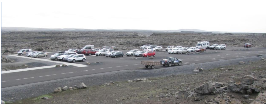
Bílastæði við Dettifoss.