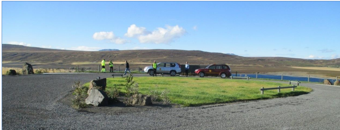
Áningarstaður við Norðausturveg í grennd við Vopnafjörð.