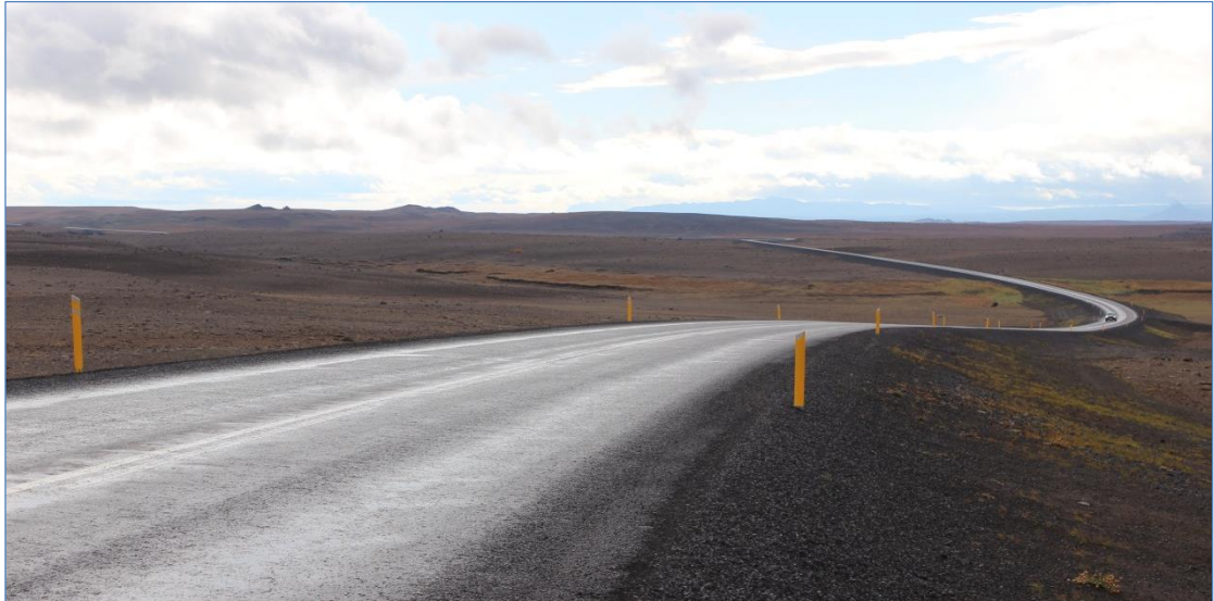
Dettifossvegur (862), Hringvegur – Dettifoss.