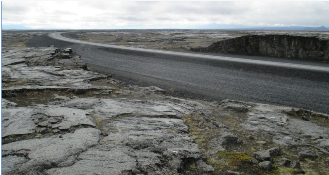
Dettifossvegur (862), Hringvegur – Dettifoss.