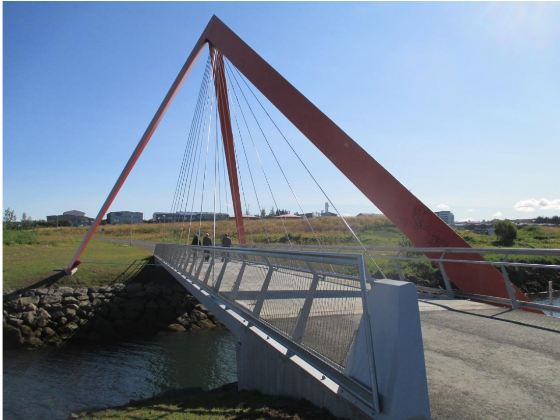
Göngu og hjólabrýr við Elliðaár