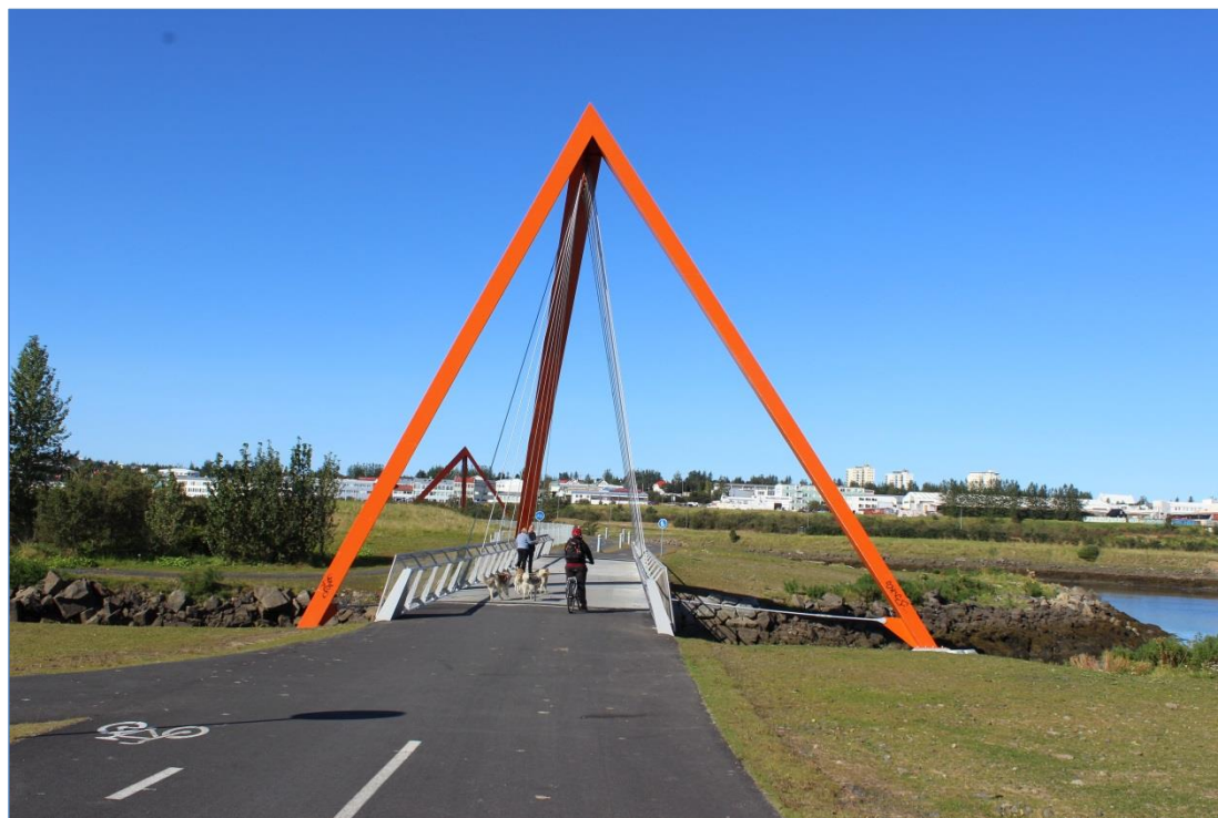
Göngu og hjólabrýr við Elliðaár.

Verkkaupar voru Reykjavíkurborg og Vegagerðin.