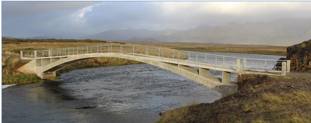
Gömul uppgerð brú yfir Haffjarðará.