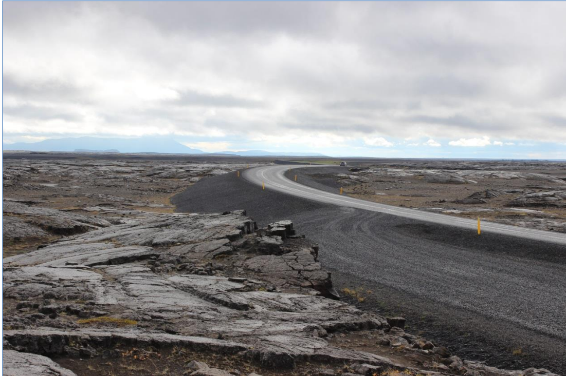
Dettifossvegur (862), Hringvegur – Dettifoss.

Vegurinn liggur um ógróið sandsvæði vestan Jökulsár á Fjöllum. Hann leysti af hólmi niðurgrafinn og hlykkjóttan vegslóða með mörgum blindhæðum og litlu burðarþoli. Vegurinn er uppbyggður og það hefur tekist að fella hann að landslaginu, þannig að náðst hefur fram tæknilega góð veglína sem eykur öryggi vegfarenda, án þess að draga úr upplifun þeirra af sérstöku landslaginu. Frágangur er góður og einfaldur, unninn í samráði við yfirvöld þjóðgarðsins í Jökulsárgljúfrum og Landgræðsluna. Áningarstaður og bílastæði eru vel heppnuð hvað varðar staðsetningu, gerð og frágang.