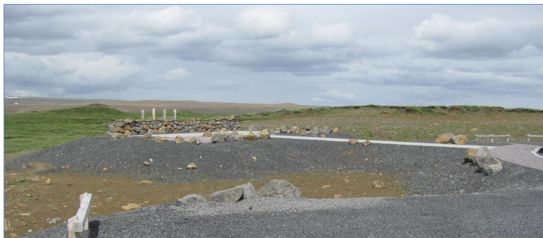
Áningarstaður við Dettifossveg.

Vegurinn er mjög fallegur á kafla þar sem gróðurinn í gömlu sjávarbökkunum hangir fram yfir kletta ofan vegar, en að mati dómnefndar hefði uppgræðslan mátt vera í meira samræmi við umhverfið.