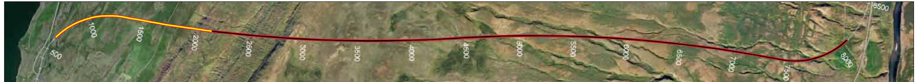
Vaðlaheiðargöng, staða framkvæmda 20. janúar 2014. Bútið er að sprengja 1.518 m frá Eyjafirði sem er 21% af heildarlengd.