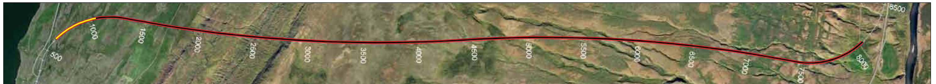
Vadlaheiðargöng, staða framkvæmda 26. ágúst 2013, Búið er að sprengja 423 m frá Eyjafirði sem er 5,9% af heildarlengd.