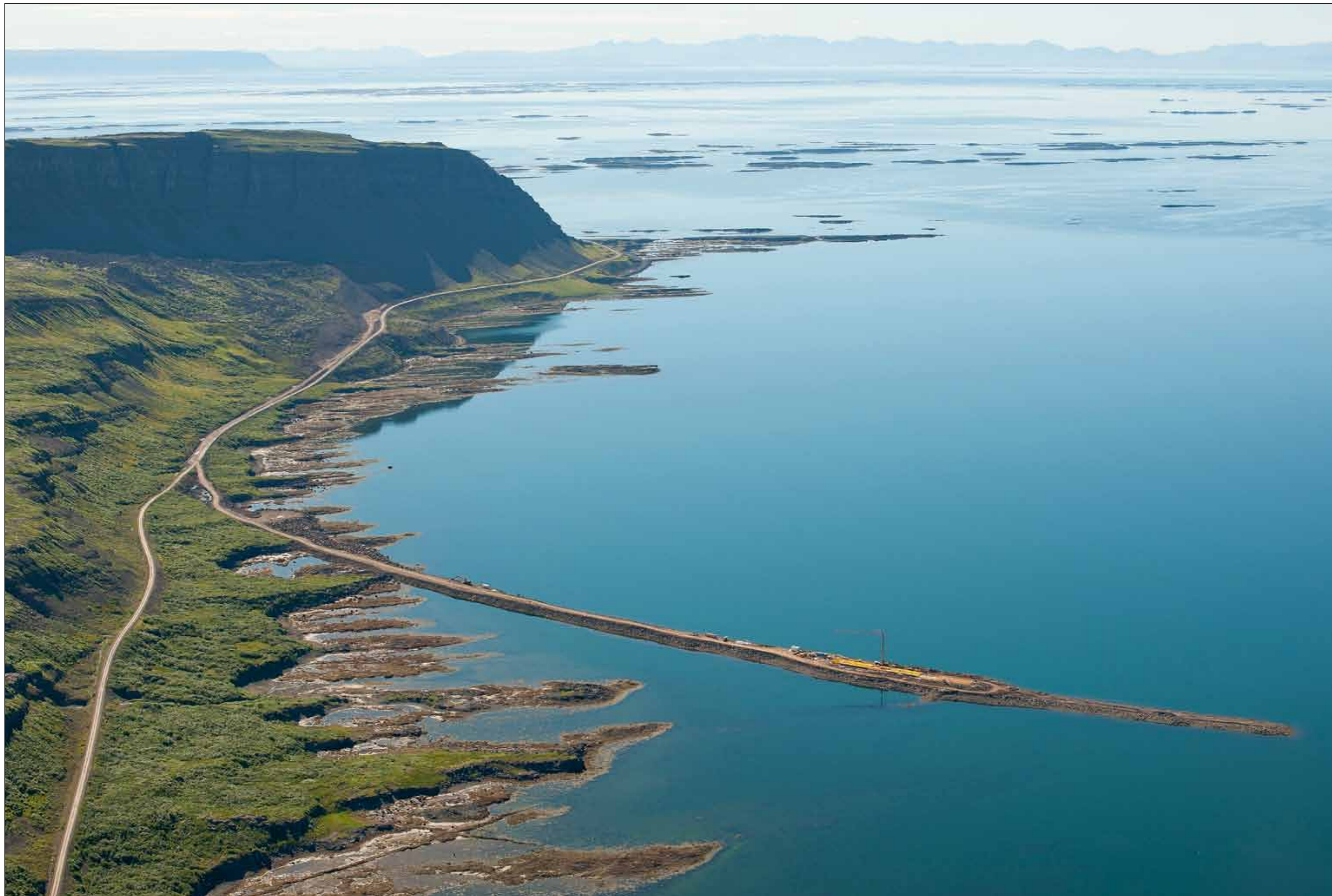
Vestfjarðavegur (60) í Kjálkafirði. Brúar- og vegagerð. Verkstaki: Suðurverk hf. 5. ágúst 2013.