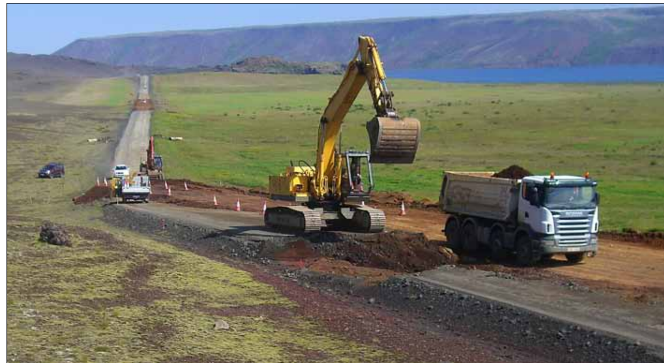
Krýsuvíkurvegur 25. júlí 2013. Endurbættur var 2,2 km kaflí af malarvegi frá Fremra- Nýjalandi að Syðristapa. Nokkur ræsi voru endurnýjuð og síðan var lagt bundið slitlag á kaflann.