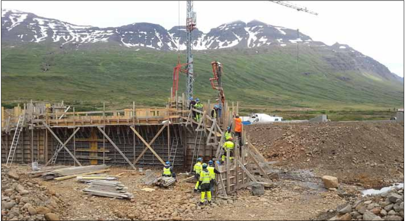
Norðfjarðará, brúargerð vegna væntanlegra Norðfjarðarganga. Ljósmynd: Guðmundur Þorsteinn Bergsson, Verkís, 8. ágúst 2013.