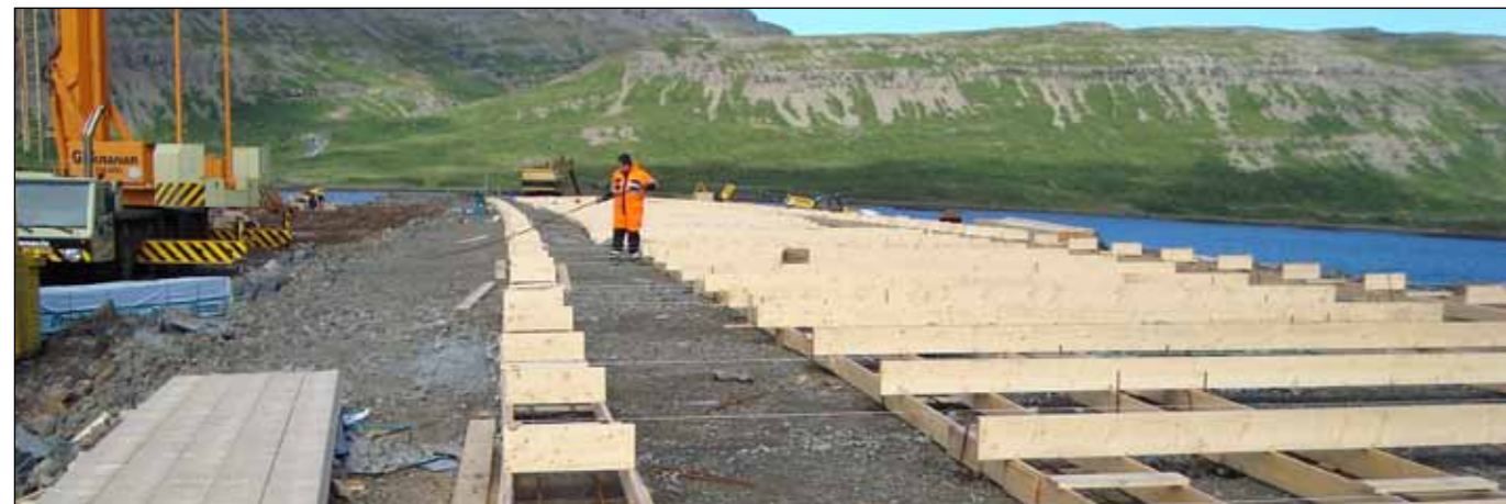
Brúargerð í Kjálkafirði 17. júlí 2013. Verktaki: Suðurverk hf.