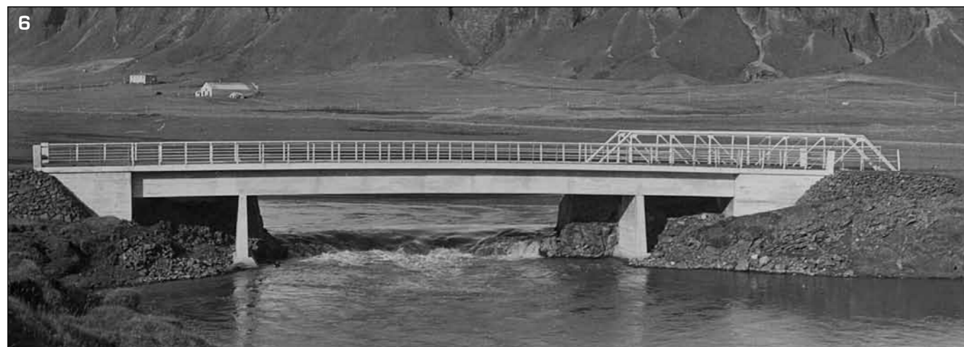
6 Skaftá, syðri strengurinn. Steipt brú frá 1952. Stálgrindarbrúin frá 1924 hefur verið dregin af ánni og bíður uppi á landi eftir nýju hlutverki.