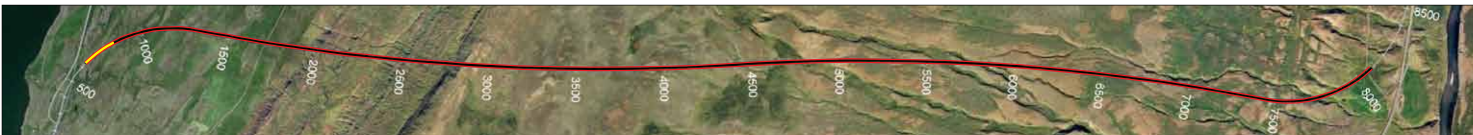
Vaðlaheidargöng, staða framkvæmda 29. júlí 2013, Búið er að sprengja 183 m frá Eyjafirði sem er 2,6% af heildarlengd.

framkvæmdin einnig til endurgerðar á norðurenda Aðalgötu og endurgerðar á tengingu Aðalgötu við Strandveg. Við framkvæmdina verður óburðarhæft efni grafið úr vegstæðinu, og burðarhæfu efni úr námum ekið í vegstæðið í staðinn. Í götuna verða lagðar niðurfallsagnir, sem tengjast núverandi fráveitukerfi Sauðárkróks. Við lok framkvæmda verður gróðurmold jafnað yfir hliðarsvæði og önnur svæði sem raskast vegna framkvæmdarinnar. Hlutar þessara svæða verða þökulagðir en sáð verður grasfræi í afganginn. Aðgerðir á framkvæmdatíma Framkvæmdaaðilar munu stuðla að því að umferð verktaka einskorðist við framkvæmdasvæðið og vegi að námum. Gerðar verða ríkar kröfur um merkingar á vinnusvæði- ▶