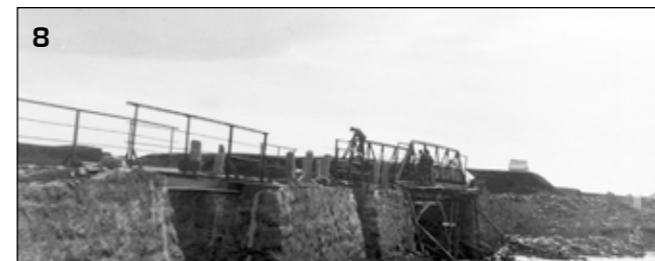
8 Skaftá, stálbrýr settar á nyrðri strengina 1924.