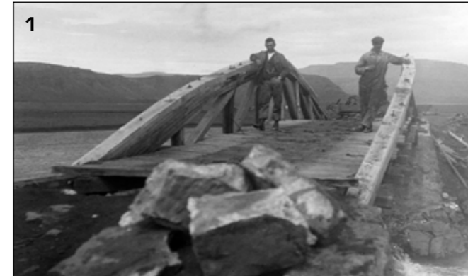
Skaftá, trébrú á syðri strengnum frá 1903 dugði fyrir hestaumferð.

Það er fágætt í samgöngusögu landsins að á hafi verið brúuð fjórum sinnum á sama stað og það á réttri öld en slíkt hefur átt sér stað á Skaftá við Kirkjubæjarklaustur. Það var Baldur Þór Þorvaldsson verkfræðingur sem benti ritstjóra á þessa staðreynd. Reyndar má segja að Múlavísl verði nú brúuð í