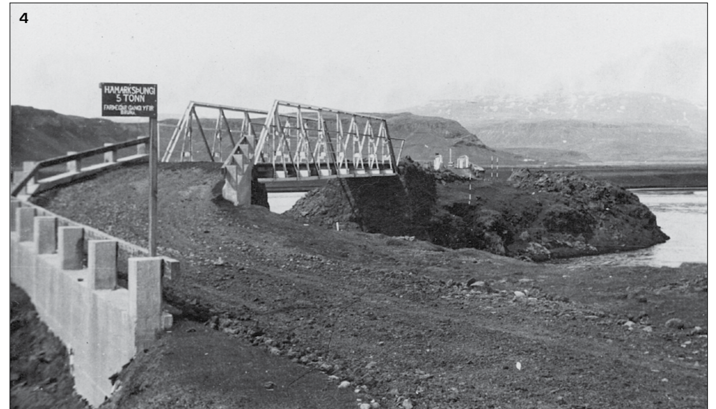
Skaftá, syðri strengurinn, Grindarbitinn frá 1924. Á skiltinu stendur „Hámarksþungi 5 tonn, farþegar gangi yfir brúna.“ Myndin er tekin 28. maí 1952 og verið er að undirbúa gerð nýrra brúa. Það má sjá mælistikur í bakgrunni. Takið eftir stoðvegnum á vinstri hönd.