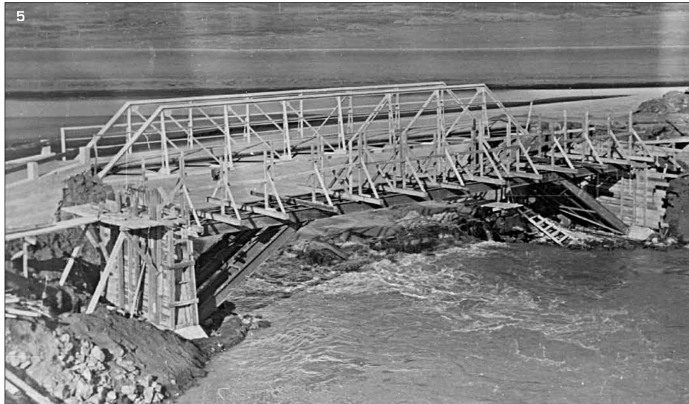
5 Skaftá, syðri strengurinn. Ný steipt brú í byggingu 10. september 1952. Stálgrindarbrúin frá 1924 sést fyrir aftan upppláttinn. Búið er að gera tvo millistöpla. Stálbitar bera upppláttinn uppi og skástífur eru til styrkingar.