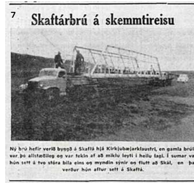
Tíminn 24. ágúst 1958.