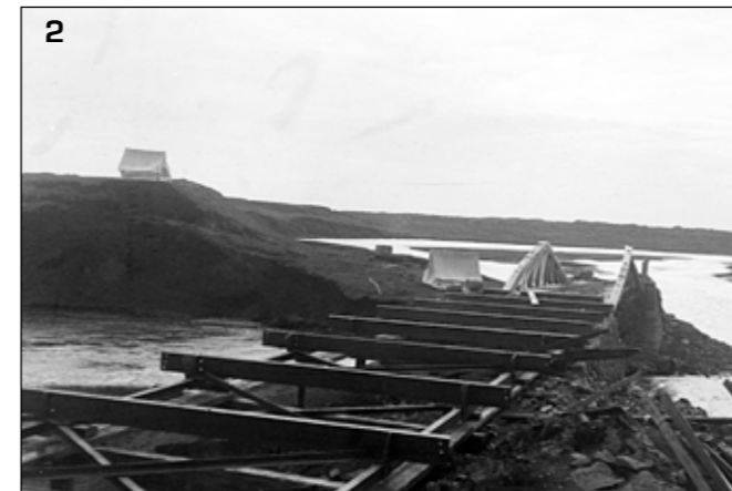
Syðri strengurinn, brúargerð 1924. Grindarbitinn undirbúinn.

fjórða sinn á sama stað ef bráðabirgðabrúin sem nú stendur er talin með. Þar hefur brúarstæðið reyndar hnikast til um nokkra tugi metra á milli brúa. Trébrýr á Jökulsá á Dal hjá Fossvöllum voru endurnýjaðar nokkrum sinnum en ekki er gott að segja hvað þar skuli kalla nýja brú. Ef einhver þekkir til fleiri staða væri gaman að fá upplýsingar um það.