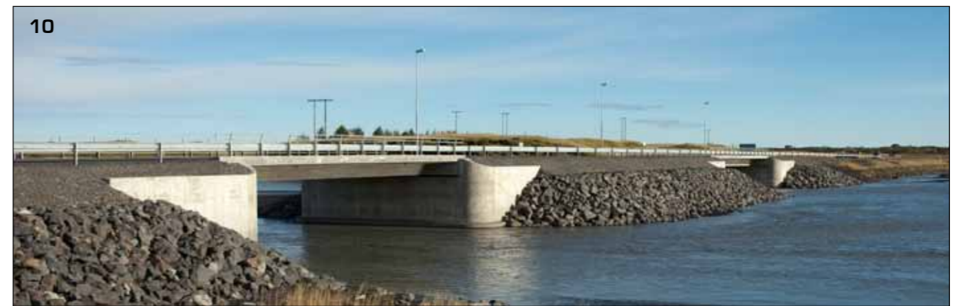
10 Skaftá, brýrnar frá 2003. Rafmagnsstaurarnir í baksýn sýna afstöðuna miðað við mynd 9. Myndin er tekin 3. ágúst 2007.

að undirbúa gerð nýrra steyptra brúa sem byrjað var á síðar um sumarið.