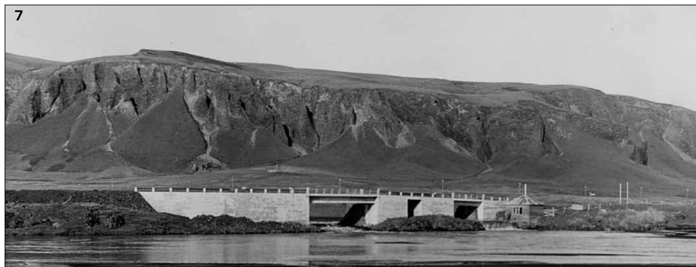
7 Skaftá, nyrðri strengirnir. Brýr frá 1953. Myndin er tekin í vestur.