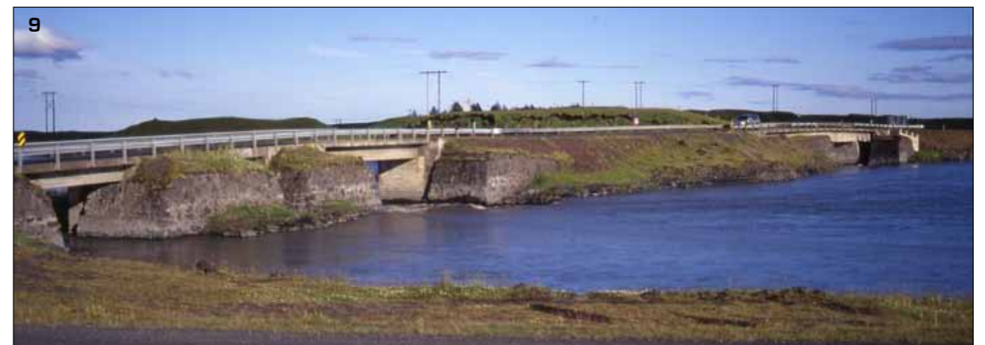
9 Skaftá, brýnar frá 1952-3. Myndin er tekin 23. júlí 2002. Handrið hafa verið tekin af og vegrið sett í staðinn.