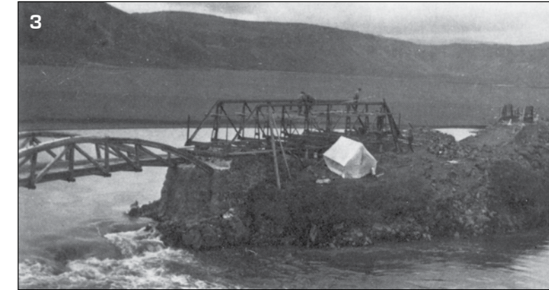
Skaftá, syðri strengurinn, brúargerð 1924. Grindarbitinn settur saman. Brú á nyrðri strengnum sést í baksýn.