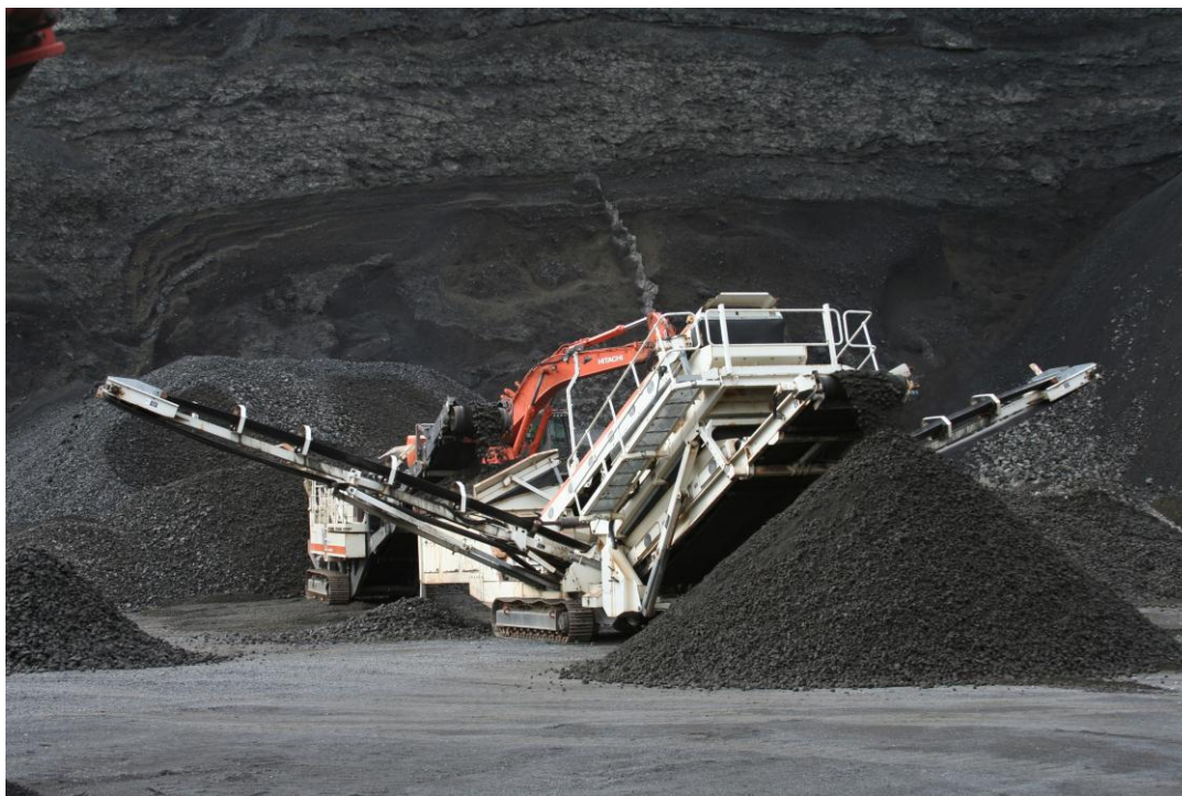
Vinnsla steinefnis í námu

Steinefnið , mölin þarf að vera í frostlausu byrgi svo hægt sé að nota það að vetrinum. Það má gjarnan vera rakt, þannig vinnur það best með viðloðunarefninu.