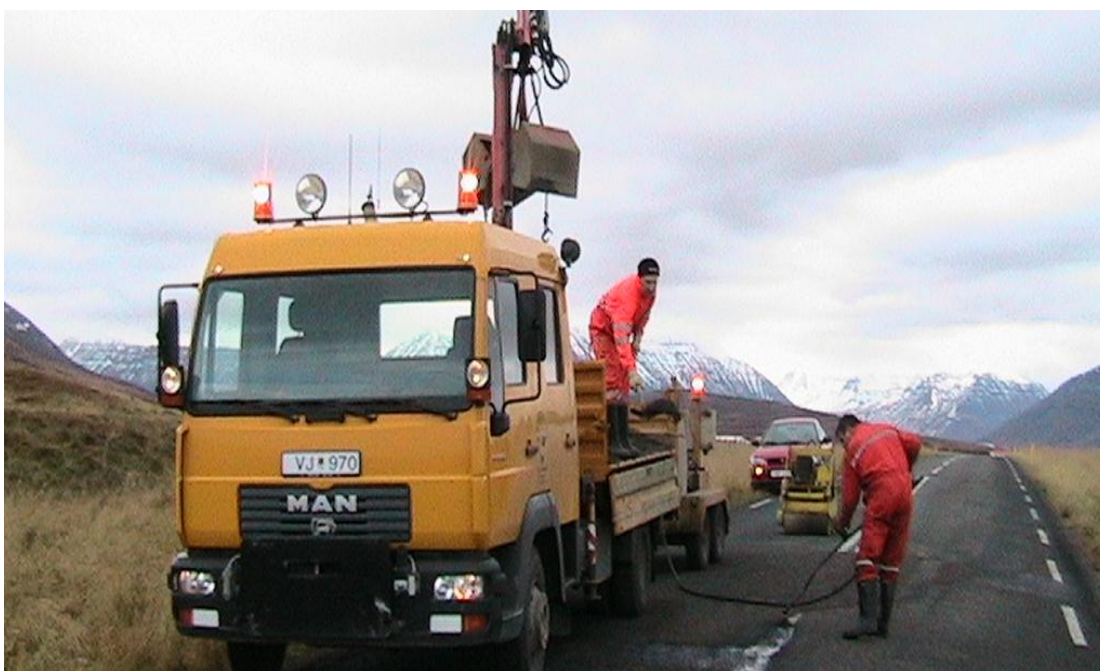
Viðgerðarbíll - þjónustubíll

Bílstjórinn verður að hafa réttindi til að aka því ökutæki sem notað er. Stjórnendur verða að ganga úr skugga um að bílstjórar hafi tilskilin réttindi. Bíllinn með kerrum og öðrum búnaði verður að vera í fullkomnu standi og geta staðist skoðun hvenær sem að honum er komið. Að auki verður hann að vera búinn þeim merkjum og ljósum sem krafist er í reglum um merkingar vinnusvæða .