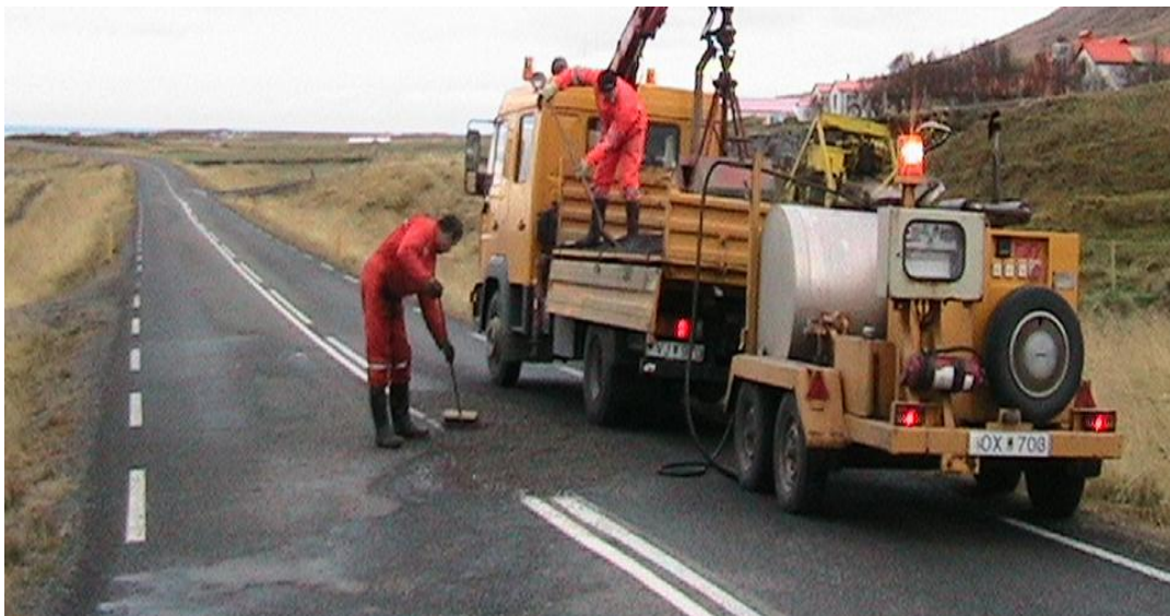
Tjörvi; vagn með geymum með hitunarbúnaði dreginn af þjónustubíl

Viðgerðartækið, tjörvinn, er dreginn vagn með geymum og hitunarbúnaði sem halda bindiefninu heitu. Í honum er dæla sem dælir 140 °C heitu bindiefni út í gegnum barka sem hefur handfang og loka á endanum sem opnar og lokar fyrir bununa. Á endanum eru tveir til þrjár spíssar sem heitt bindiefni kemur úr. Þetta er allt heitt og verða starfsmenn að vera búnir í samræmi við það og umgangast þessi heitu verkfæri og efni með viðeigandi hætti.